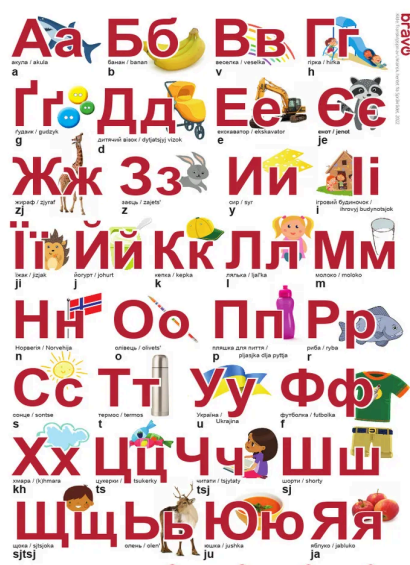
det kyrilliske alfabetet